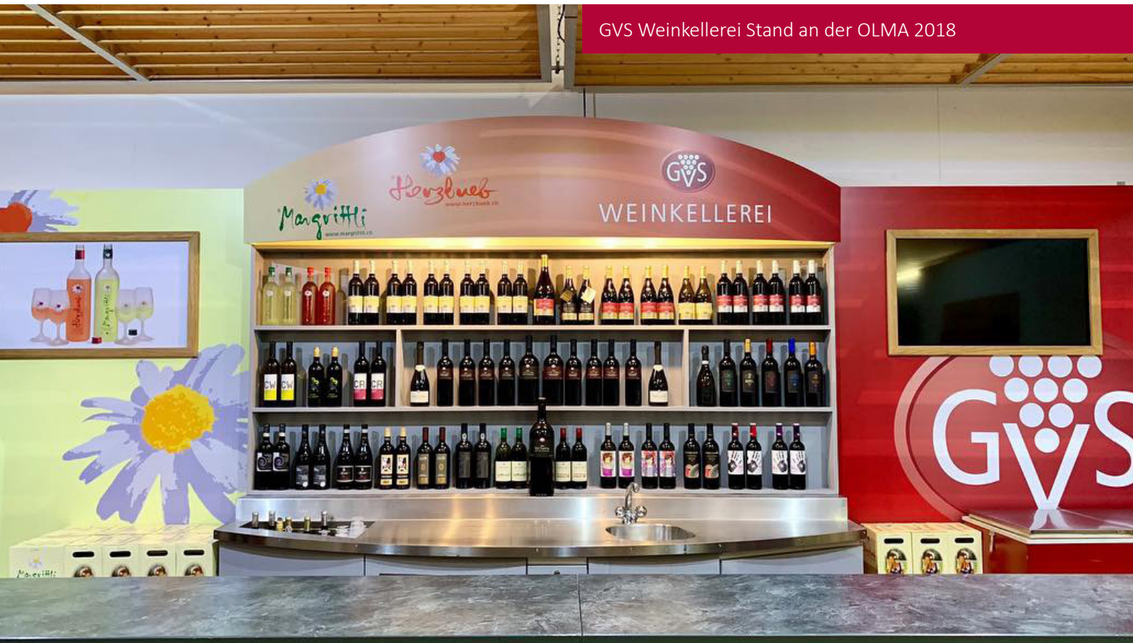
GVS Weinkellerei Stand an der OLMA 2018