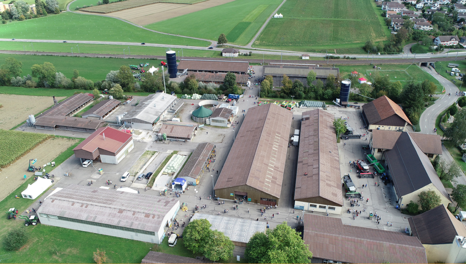
Impressionen der Eröffnung unseres Leuchtturm-Projekts Swiss Future Farm