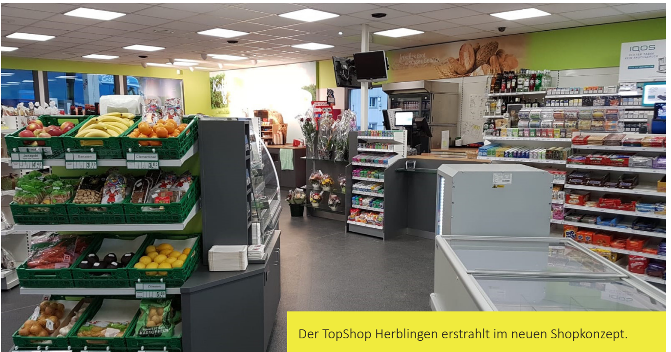
Der TopShop Herblingen erstrahlt im neuen Shopkonzept.

«DER LANDI LADEN IN HERBLINGEN TRITT AB JANUAR 2019 IM NEUEN LANDI LADEN KONZEPT 2.0 AUF.»