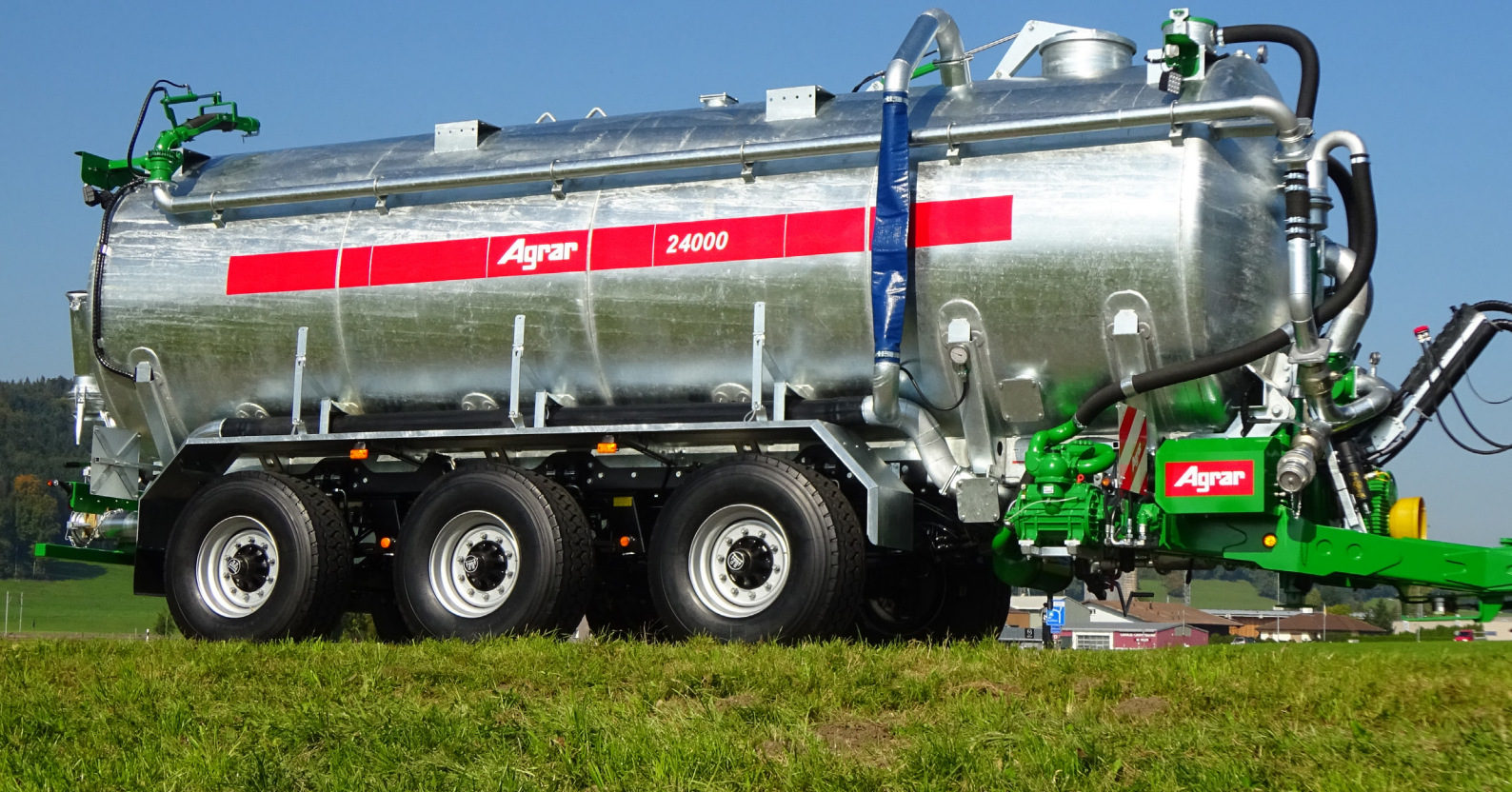
Innovationen der Agrar Landtechnik AG: Oben: 24'000 lt. Transportfass mit BPW-Tridemfahwerk und hydraulischem Achsausgleich Unten: Hochgangladewagen neu mit leistungsoptimierter Dosieranlage