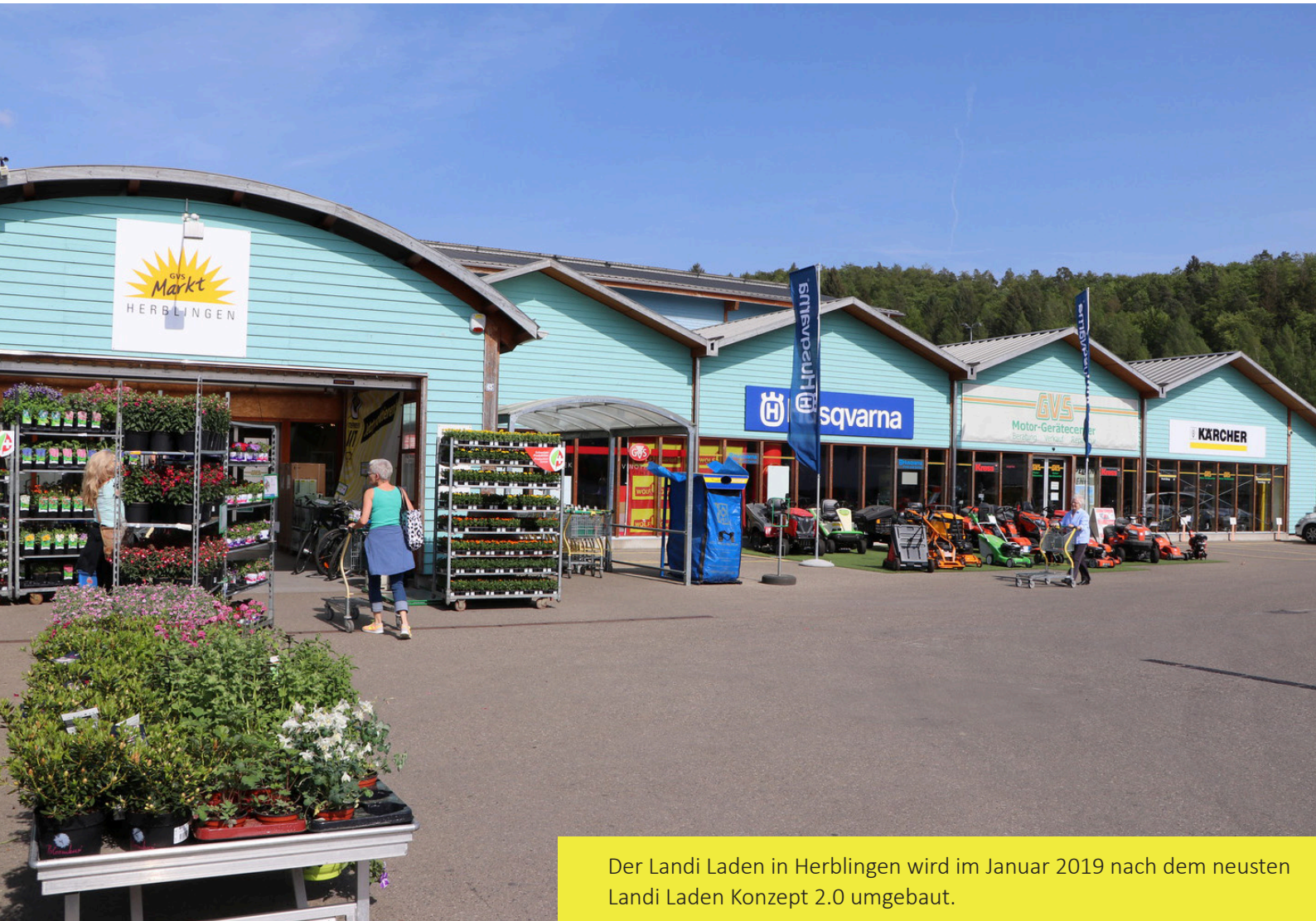
Der Landi Laden in Herblingen wird im Januar 2019 nach dem neuesten Landi Laden Konzept 2.0 umgebaut.